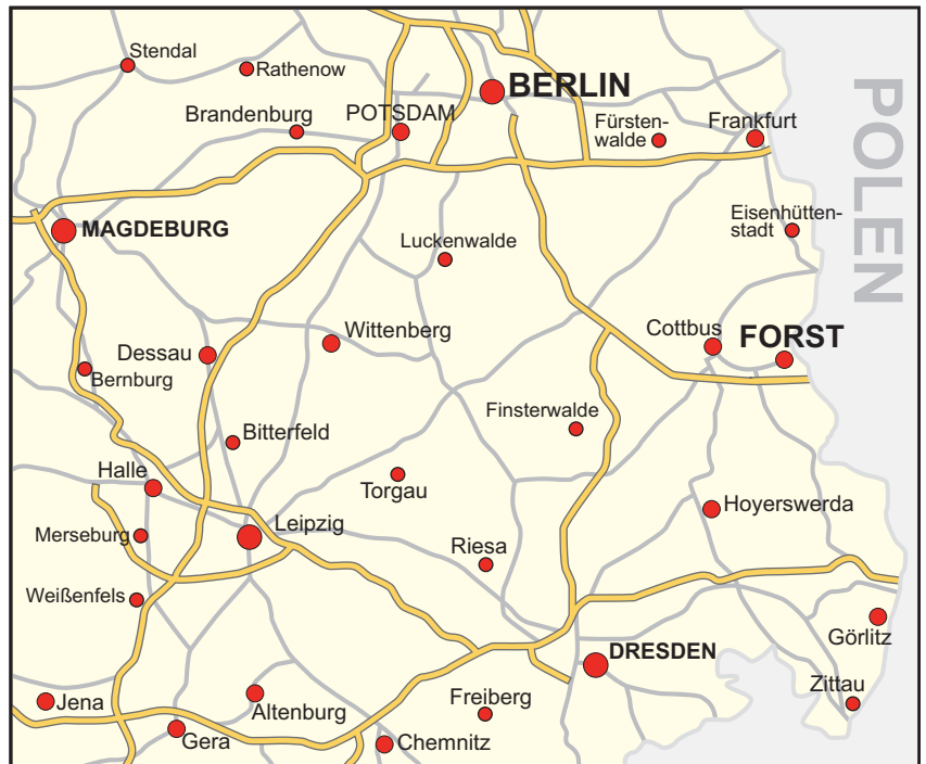
Anfahrt nach Forst